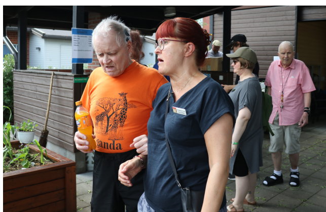
Aistipuutarhassa nautittiin Lions Club Harjun paistamia lettuja ja makkaraa.