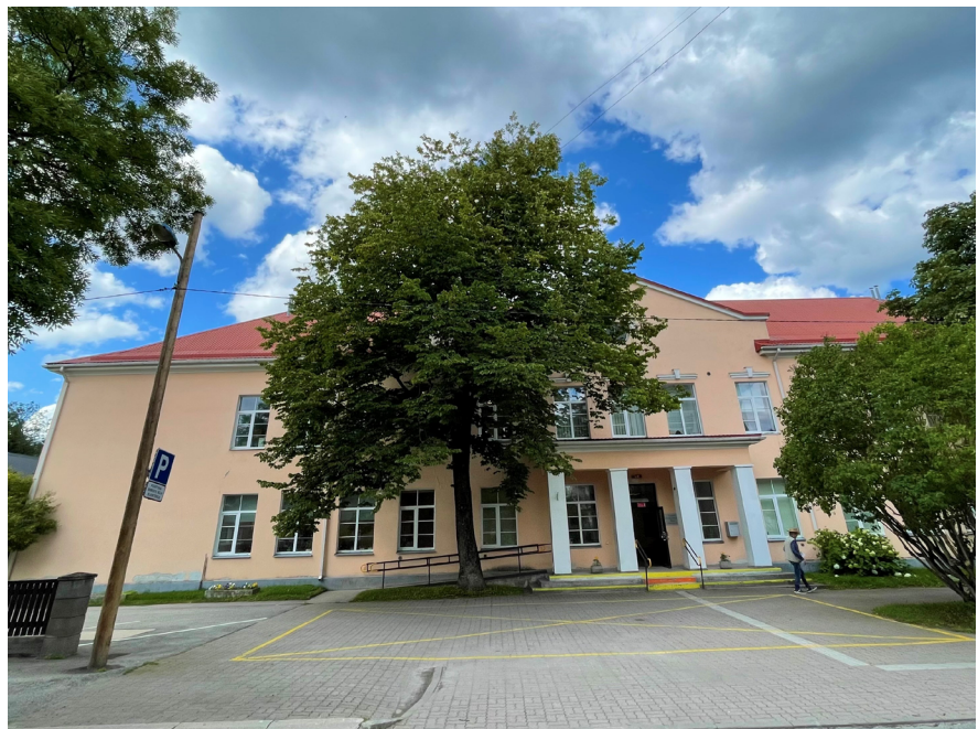
Viron vammaisjärjestöjen talo Tallinnassa.