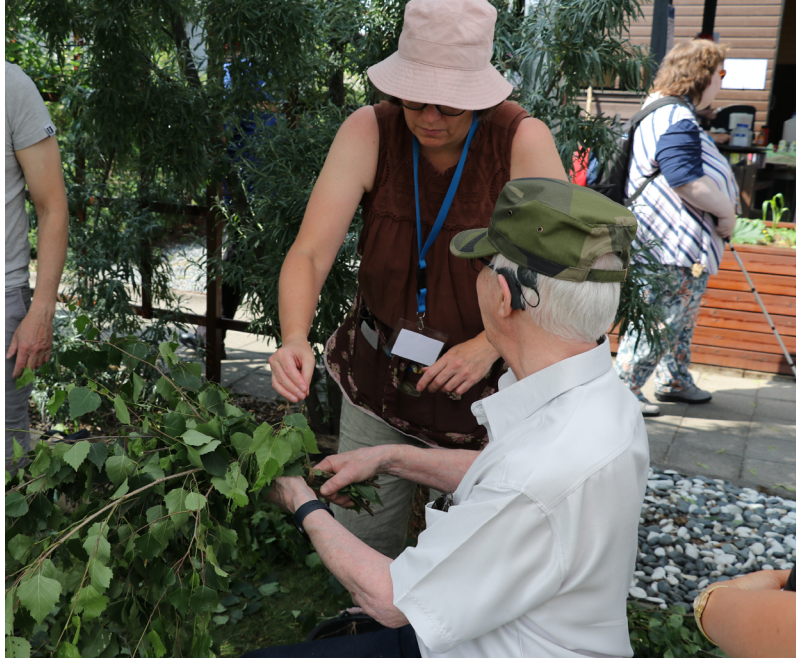
Saunavihtapajassa syntyi hienoja vihtoja.