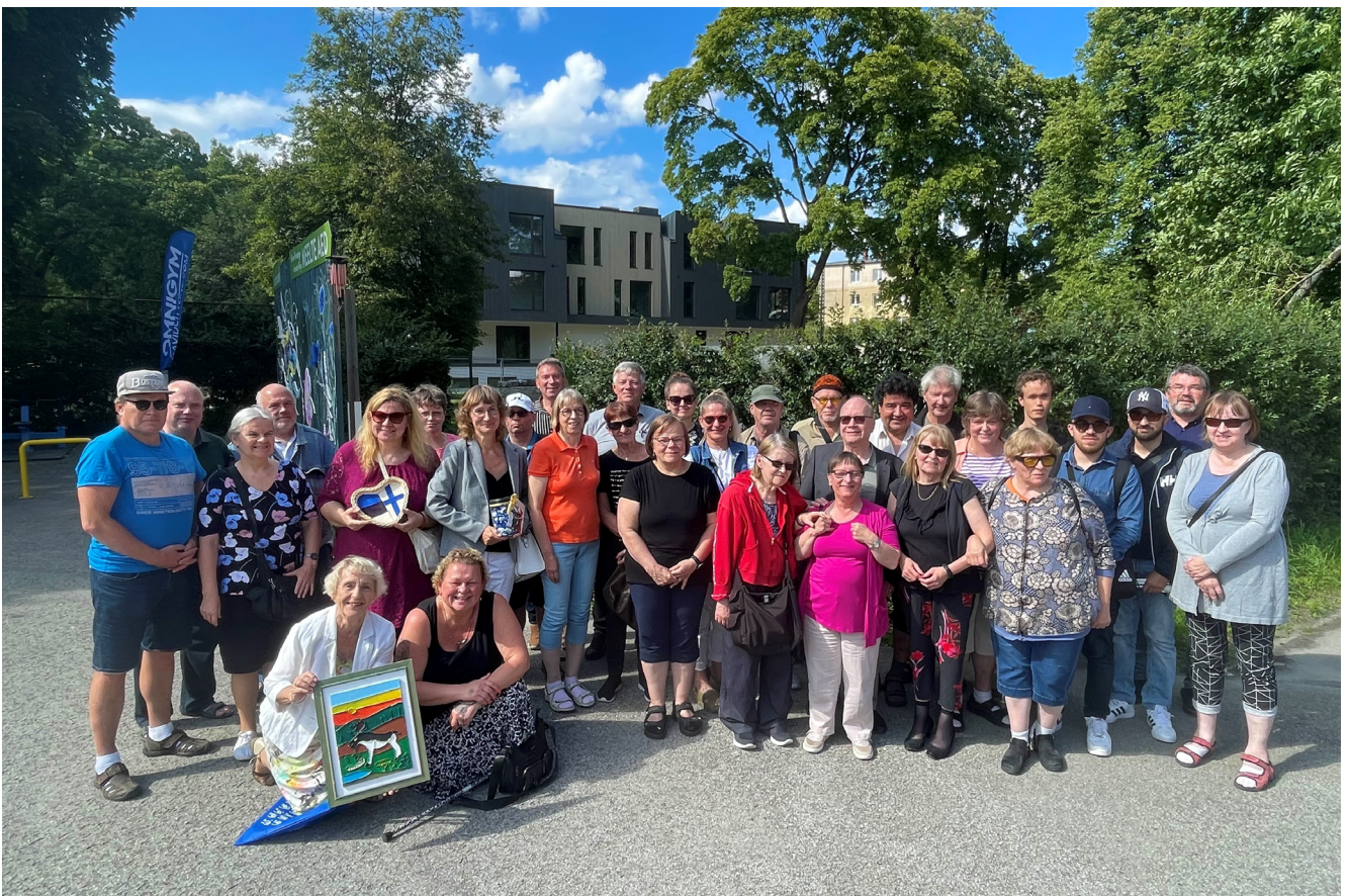
Ryhmäkuva Tallinnassa suomalaisista ja virolaisista

Viimeisenä päivänä menimme bussilla Tallinnan suureen ostoskeskukseen, jonka katolla on mahtava