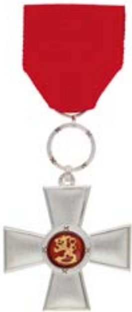
Suomen Leijonan ansioristi.

Yhdistyksen jäsenet ja työntekijät onnittelevat ansiomerkin johdosta Kaita! ■