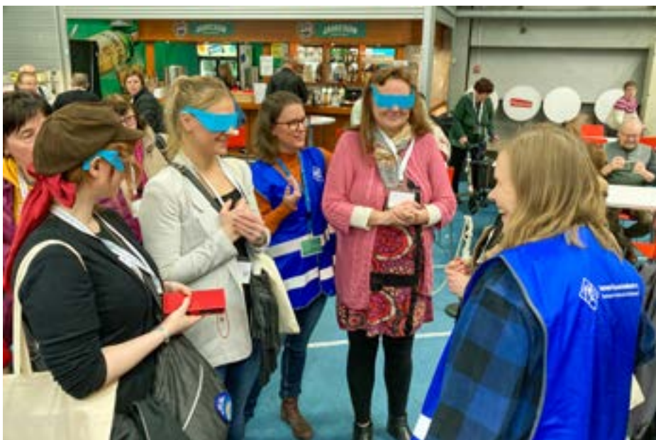
Yhdistyksen toiminnan esittelyä Apuvälinemessuilla 2023.

Sosiaali- ja terveysministeriö vahvistaa esitykset alkuvuodesta 2024. ■