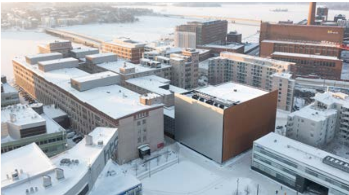
Kaapelitehdas ja Tanssin talo.

Kulttuuripäiville haetaan myös vapaaehtoisia. Ilmoittaudu sähköpostilla: vaparit2024@hky.fi ■