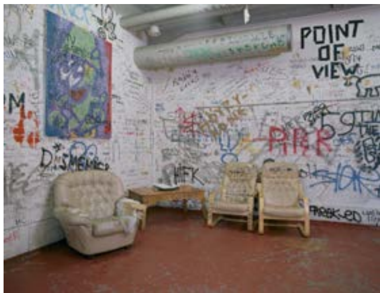
Lepakkoluola. Kuva: Maria Ylikoski, 1999. Helsingin kaupunginmuseo.